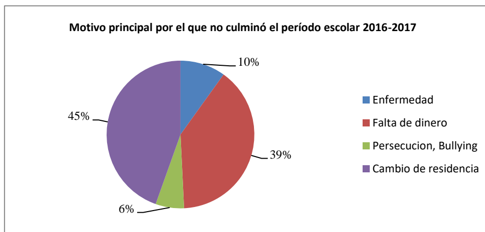
Grafico 3 Nivel de deserción escolar

Fuente: Ministerio de Educación sede Ecuador 2018 Elaborado: FLACSO sede Ecuador 2018