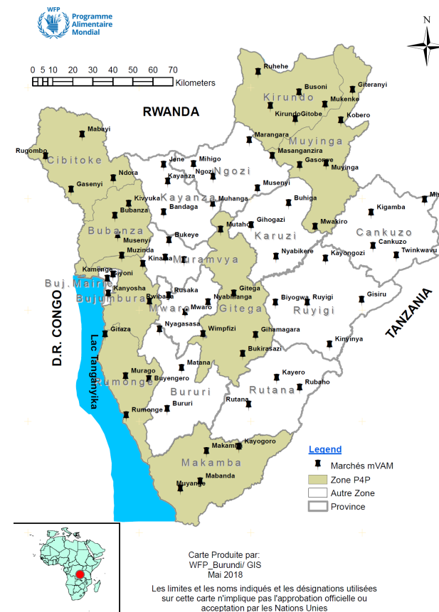
Fig. 1 : cartographie des marchés couverts par la collecte de prix

Pour le présent bulletin, les données ont été collectées sur l'ensemble du territoire du 1 er au 30 juin 2018. Le prix médian a été calculé sur la base des prix collectés sur les différents marchés au niveau des différentes provinces.