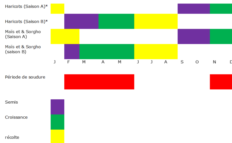
Fig. 1: Burundi : Calendrier des saisons agricole année normale (*culture principale)