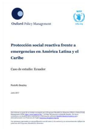
Caso de Estudio: Ecuador durante el terremoto en 2016

Sobre la base de estas actividades, en conjunto con el Mies y la SGR, WFP organizó un taller titulado "Protección social con capacidad de respuesta" en noviembre de 2017. Este evento se dirigió directamente a personal técnico con el objetivo de