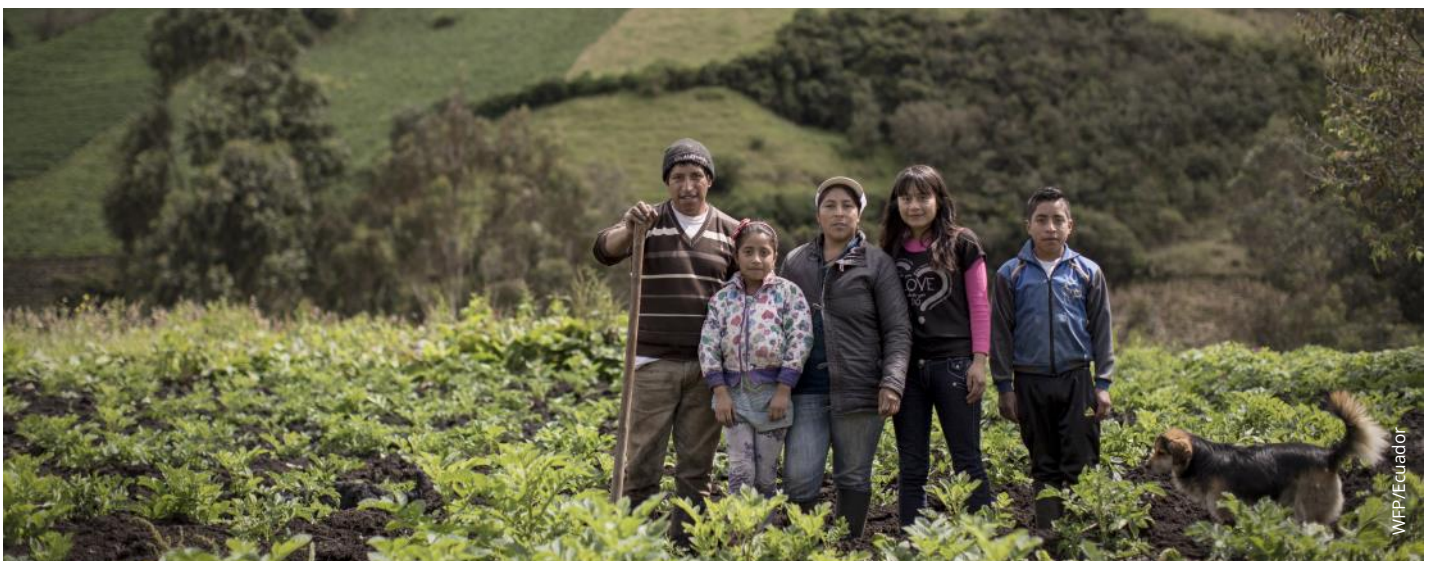
Familia de pequeños productores de la zona norte del Ecuador

Ecuador se ha convertido en el pionero en la región al promover una Ley de Movilidad Humana que reconoce la ciudadanía universal como uno de sus principios fundamentales, marcando un antes y un después en la garantía de los derechos humanos de los migrantes.