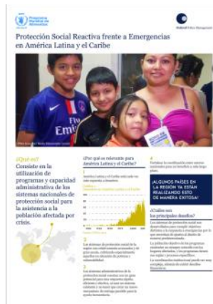
Estudio Regional de Protección Social Reactiva ante Emergencias

sistemas de protección social sean más receptivos a los choques. Sus hallazgos proporcionaron información valiosa para ajustes de políticas y lecciones aprendidas para compartir con la región.