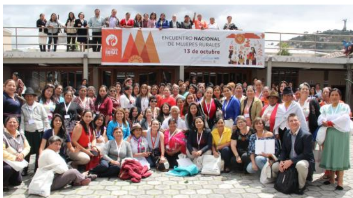
Encuentro Nacional de Mujeres Rurales "Democracia Paritaria y Agenda 2030"

En este espacio, Ecuador compartió su experiencia frente a la respuesta del terremoto de 2016, en donde alrededor de 42,600 familias recibieron transferencias en efectivo a través de la plataforma de protección social administrada por el Gobierno. Esta experiencia fue documentada como parte del "Estudio sobre Protección Social Reactiva ante Emergencias en América Latina y el Caribe" , encargado en 2017 por WFP y llevado a cabo por Oxford Policy Management (OPM). El estudio buscó analizar los factores que permiten que los