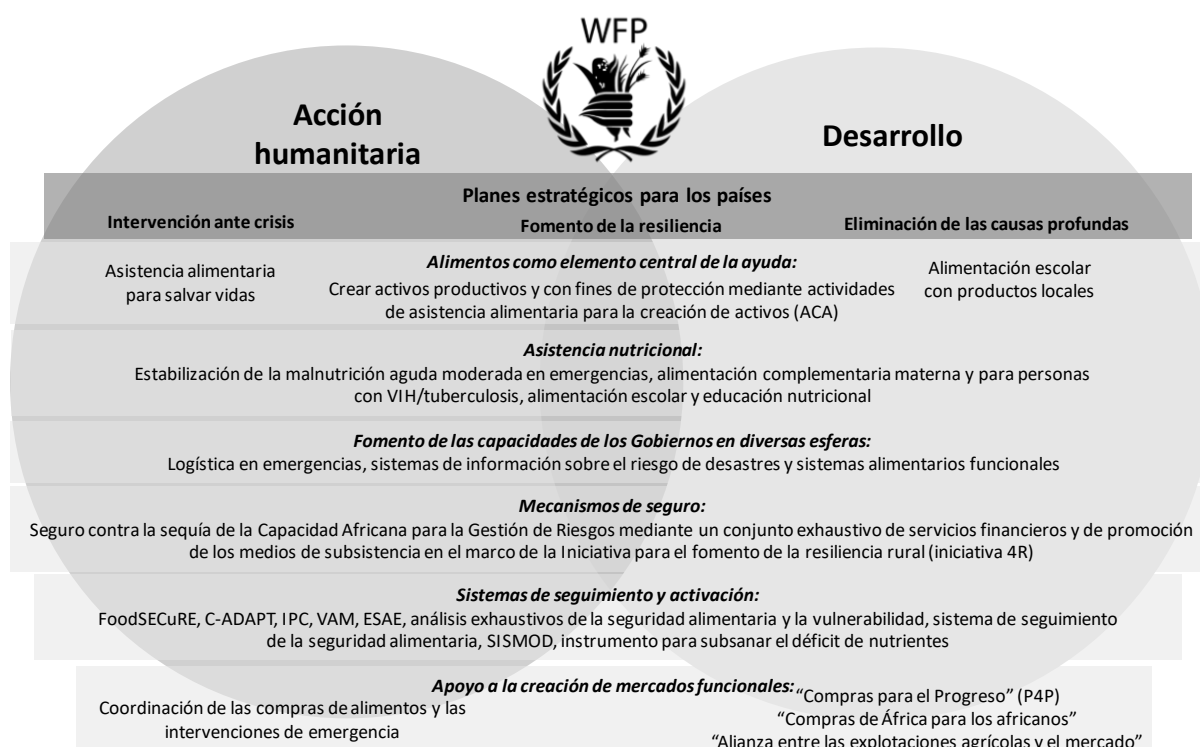
Figura 2: Labor del PMA a lo largo del nexo entre acción humanitaria y desarrollo