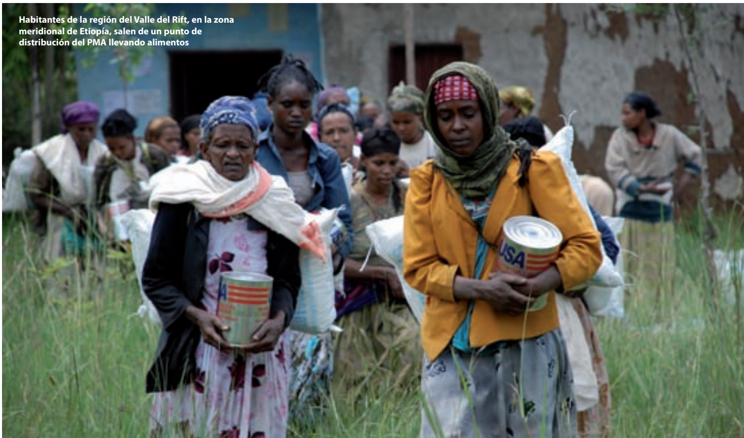
Habitantes de la región del Valle del Rift, en la zona meridional de Etiopía, salen de un punto de distribución del PMA llevando alimentos

Entre el gran número de actividades del programa se cuentan disposiciones para construir y rehabilitar caminos secundarios, reforestar laderas yermas, restablecer los manantiales y los