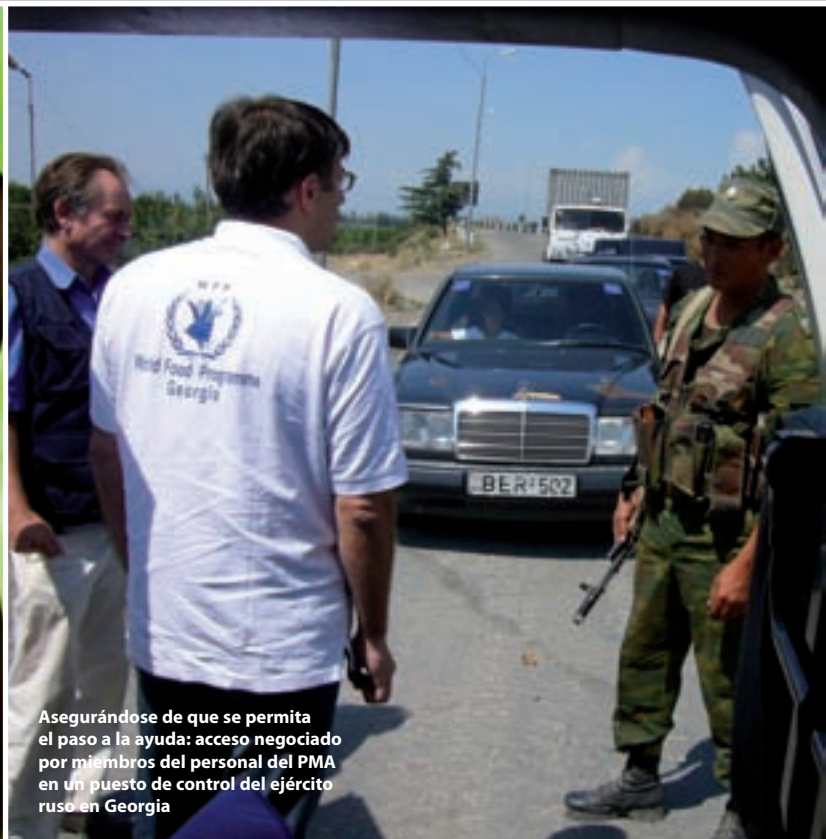
Asegurándose de que se permita el paso a la ayuda: acceso negociado por miembros del personal del PMA en un puesto de control del ejército ruso en Georgia

ayuda humanitaria y de las Naciones Unidas. Cuatro miembros del personal del PMA murieron y 17 resultaron heridos a causa de actos intencionados. Nuestros contratistas y asociados también pagaron un precio elevado: siete conductores de camiones contratados por el PMA murieron por disparos durante ataques de bandidos en el Sudán, otros cinco murieron en ataques similares en Somalia y uno más en Filipinas. También se registraron ataques contra camiones contratados por el PMA en el Afganistán, la República Democrática del Congo, Mindanao (Filipinas) y el Pakistán.