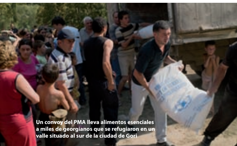
Un convoy del PMA lleva alimentos esenciales a miles de georgianos que se refugiaron en un valle situado al sur de la ciudad de Gori

El 18 de agosto, las Naciones Unidas iniciaron un llamamiento urgente para recaudar 59,7 millones de dólares con el fin de atender por un período de seis meses las necesidades humanitarias resultantes del conflicto. En ese llamamiento las necesidades correspondientes al sector alimentario se estimaron en 15,8 millones de dólares, incluidos 12,9 millones de dólares para que el PMA suministrara raciones básicas de alimentos. A principios de octubre se emitió un llamamiento revisado en el que las necesidades del sector alimentario se situaban en 32 millones de dólares, de los que 20 millones correspondían al PMA. El PMA también lanzó un llamamiento para obtener 2,5 millones de dólares con el fin de apoyar la coordinación en materia de logística y la capacidad interinstitucional de almacenamiento y transporte.