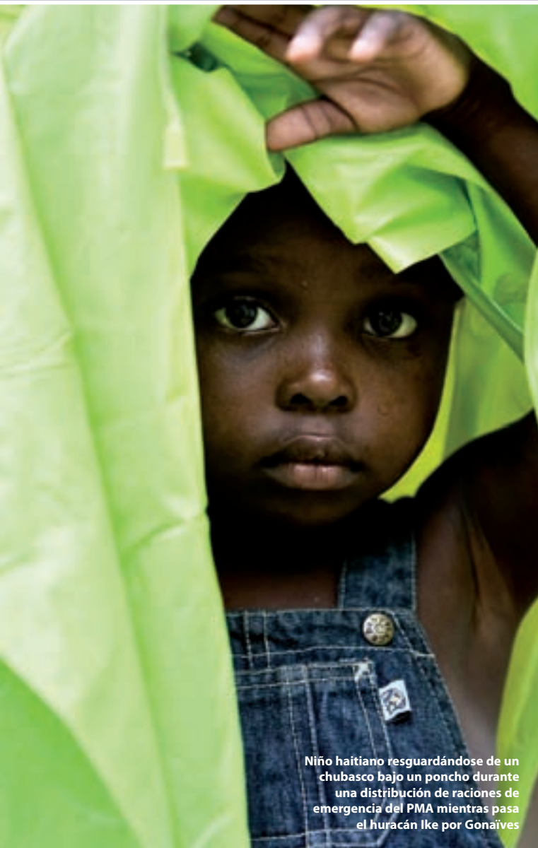
Niño haitiano resguardándose de un chubasco bajo un poncho durante una distribución de raciones de emergencia del PMA mientras pasa el huracán Ike por Gonaïves