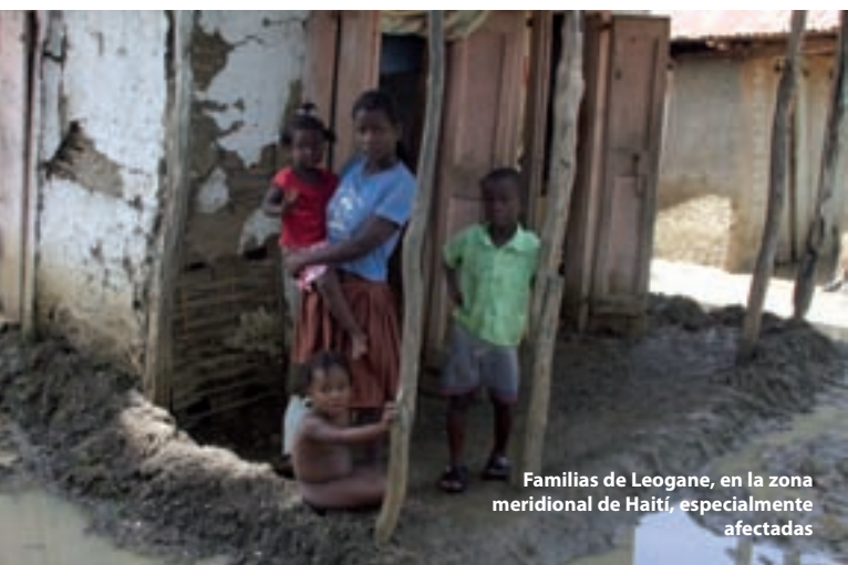
Familias de Leogane, en la zona meridional de Haití, especialmente afectadas

En el marco de una OEM de 31 millones de dólares, el PMA logró alcanzar a 800.000 personas que habían perdido sus medios de subsistencia. El PMA hizo distribuciones generales de alimentos, amplió los programas de alimentación escolar y de alimentación