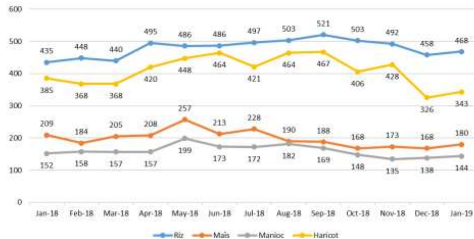
Graphique 1 : Médiane des prix des principales denrées (jan 2018—jan 2019)

Le prix du riz a connu une baisse de -5 pour cent en janvier 2019 par rapport à novembre 2018. On relève une baisse importante du prix de cette denrée dans les localités de Bozoum (-23%) et Mbaïki (-20%). Cette diminution est due à la période du décorticage du riz local dans lesdites localités. Toutefois, on observe une augmentation de son prix à Bria (+25%) qui résulte du faible ravitaillement causé par l'insécurité.