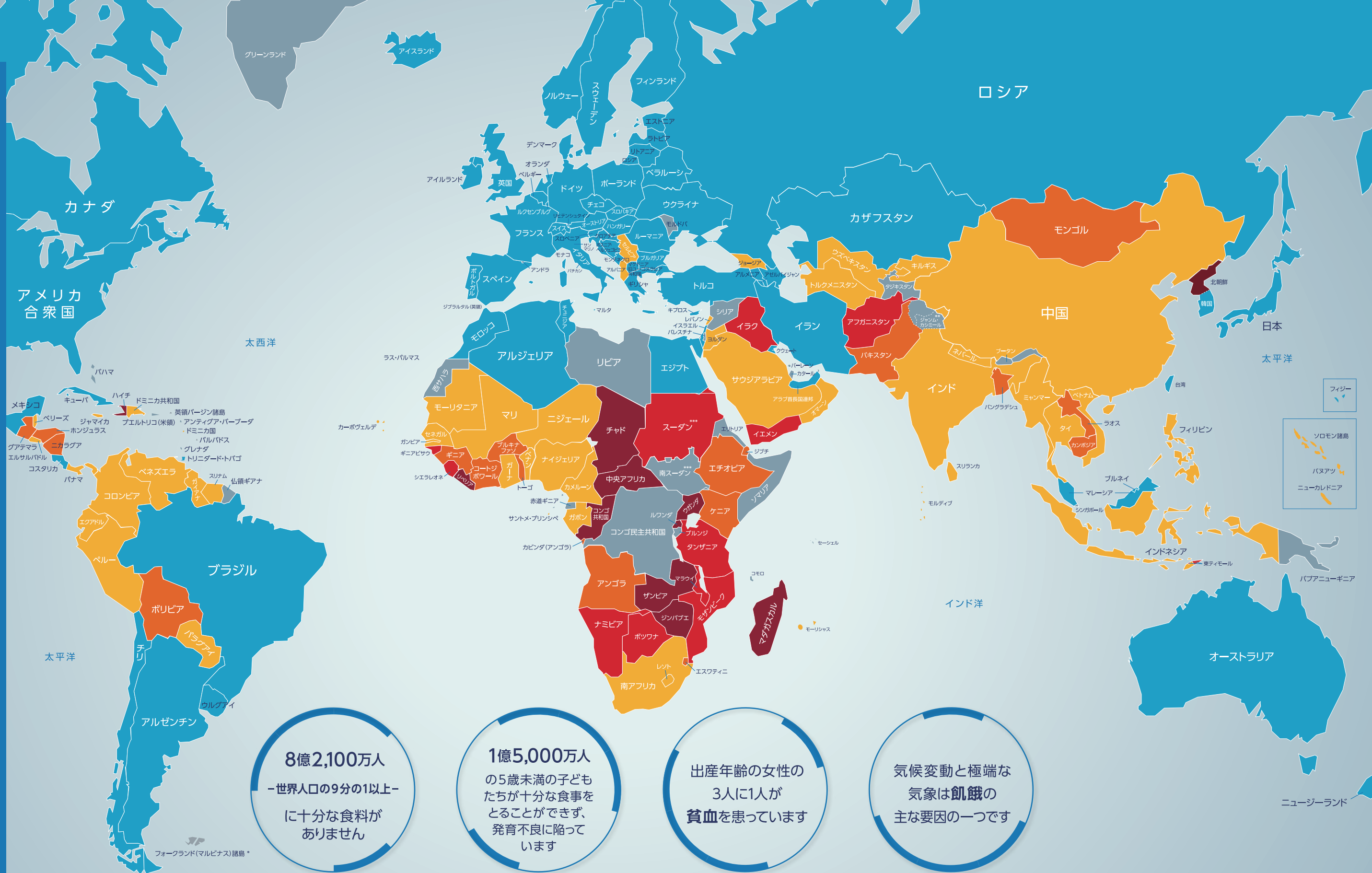
栄養不足の人口の割合 (2015~2017)