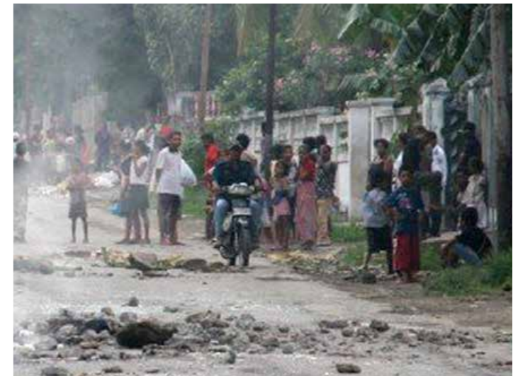
Crize politika iha Dili, 2006.

WFP, no ONG hirak-seluk ho foku ba saúde no nutrisaun estabelese tiha programa ai-han suplementár iha área hirak-ne'ebá.