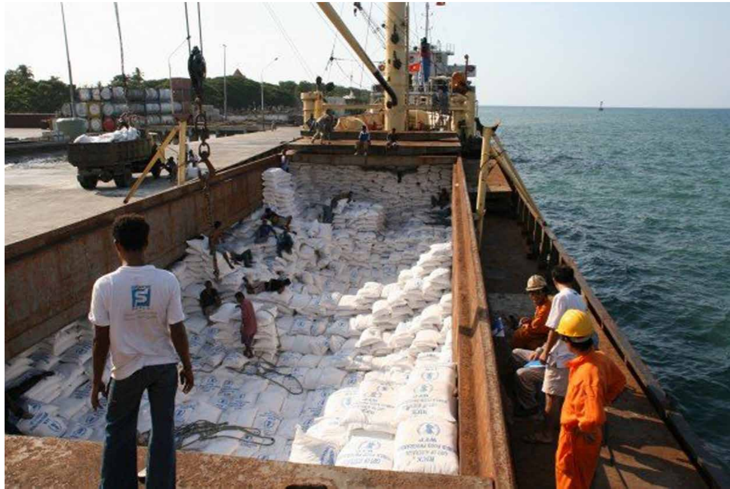
Hasai aihan hosi WFP ne'ebe foin too ho ro. 2000.

Iha inisiu tinan 2000, WFP hahu muda hosi distribuisaun ai-han jeral ba distribuisaun ai-han alvu, hodi fornese pakote ai-han fulan-fulan hanesan foos ka batar, koto no mina ba populasaun vulneravel sira. Fo-han ba Grupu Vulneravel (FGV) lansa iha inisiu tinan 2000. Durante tinan 2000 nia laran, WFP distribui ai-han tonelada 15.000 iha teritoriu Timor laran tomak inklui Enclave Oecusse-Ambeno.