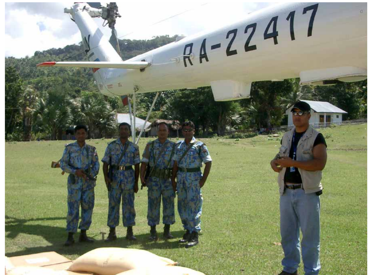
Helikoptru ONU nian hodi aihan atu halo distribuisaun.