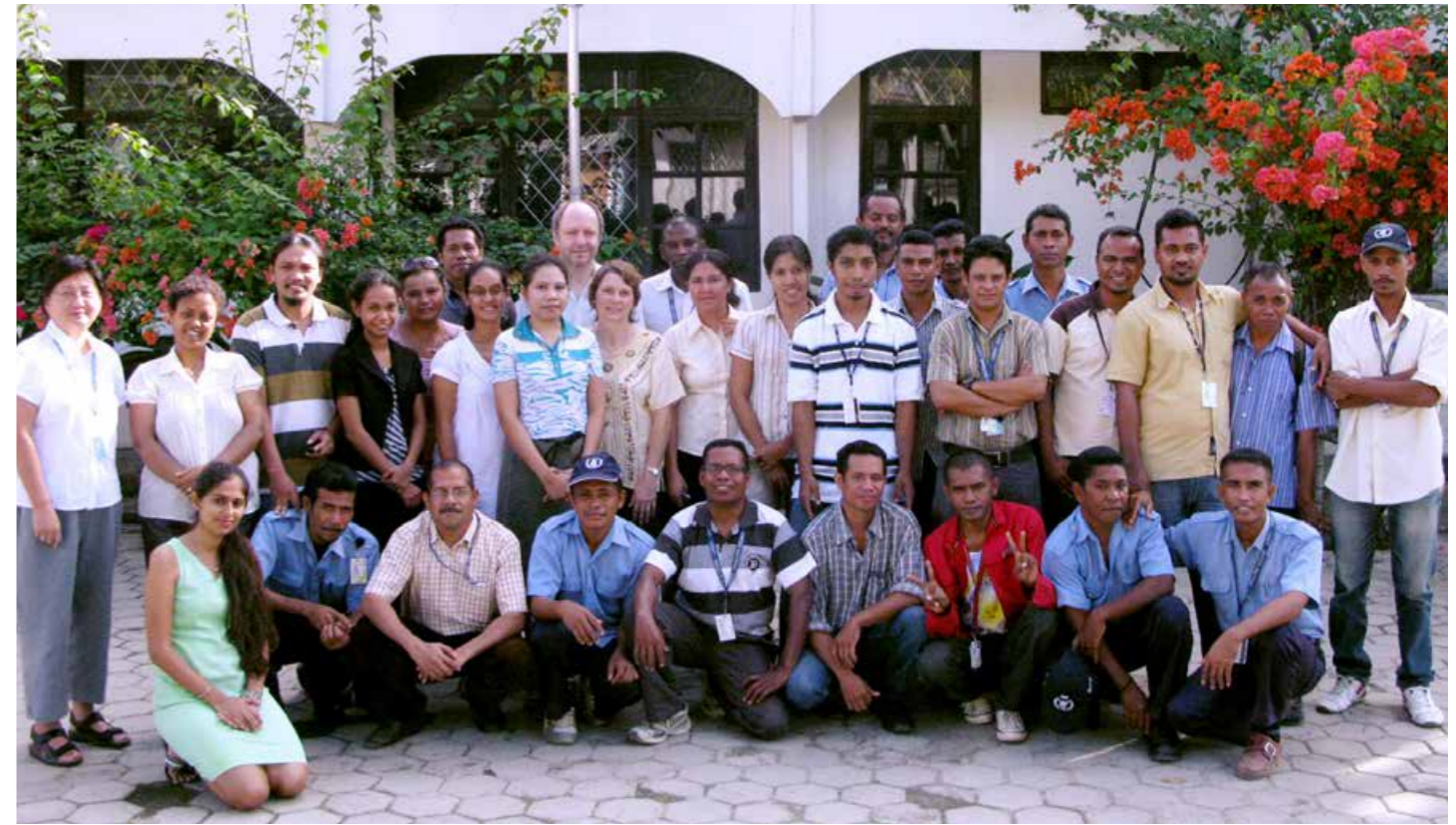
Pesoal WFP. 2010.

“Servisu ho WFP ami bele too iha area remotas, area hirak ne’ebe susar tebes atu asesu. Ami bele asesu ba kuaze eskola hotu-hotu iha Timor-Leste.”