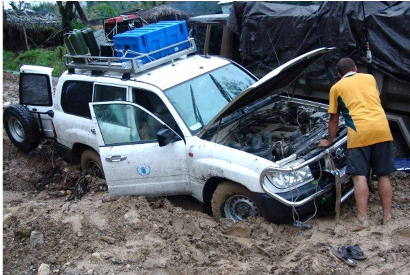
Veikulu WFP nian ne'ebe monu no metin iha tahu laran wainhira halao distribuisaun aihan ba comunidade.