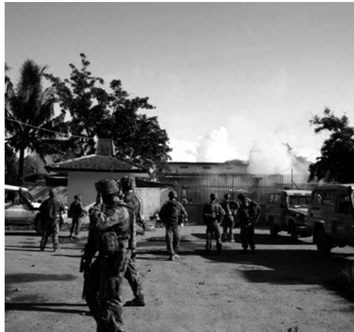
Tropa Militar durante krize iha tinan 2006.

Iha tinan 2007, WFP kontinua ninia assisténsia ba ema iha akampamentu hirak iha Dili laran ne'ebé halai hosi sira-nia hela-fatin durante krize polítiku 2006 nian no introdús tiha programa Ai-Han ba Servisu atu hamenus tensaun entre IDP sira no populasaun ne'ebé hela besik fatin IDP nian. Investigasaun iha tempu ne'ebá hatudu katak la'ós de'it 50% hosi populasaun IDP mak hasoru inseguransa ai-han iha auzénsia assisténsia ai-han, maibé 50% hosi populasaun la'ós-IDP iha Dili laran mós bele sofre inseguransa aihan. Durante período ida-ne'e nia laran, WFP mós kontinua implementa programa Saúde Inan no Oan no Programa Merenda Escolar no kontinua atu fornese kapasitasaun ba Ministériu Saúde. Adisionalmente, WFP no UNMIT asina MoU atu reabilita no harii fasilidade armazenajen iha sentru saúde sira iha distritu Covalima, Ainaro no Bobonaro.