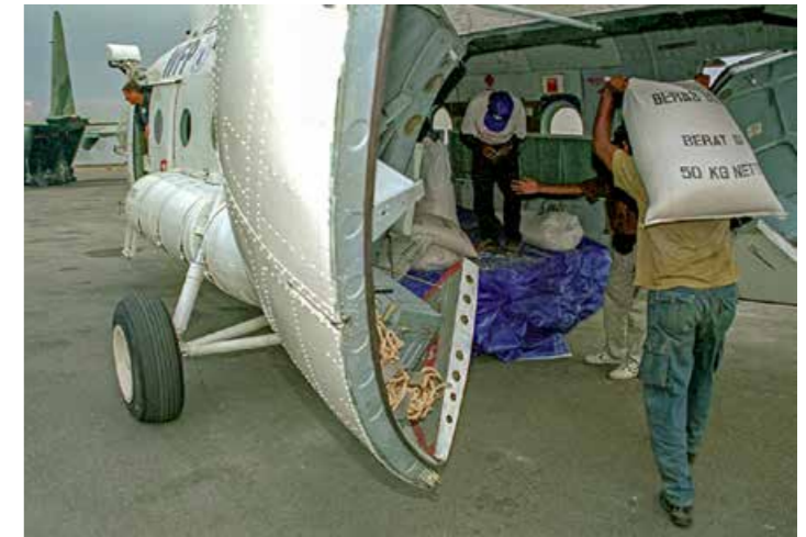
Asistensia aihan hosi WFP transfere ba aero hodi halo distribuisaun.

WFP, ofisiál Governu no parseiru balun konkorda hamutuk katak intervensaun asisténsia ai-han la'ós resposta apropriadu ba futuru Timor-Leste. Ho konsiderasaun ba konkluzau ida-ne'e, WFP foti desizaun atu hapara neineik