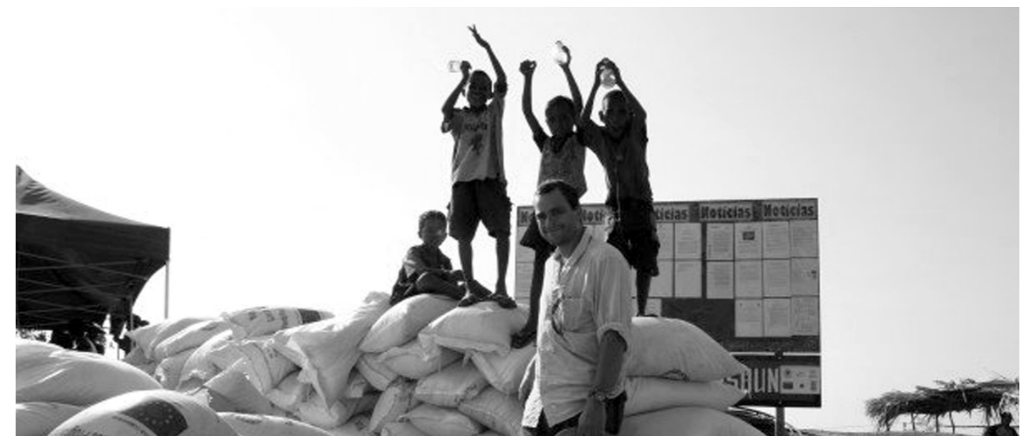
Pesoal WFP hamutuk ho labarik Timor-oan. 2000.

Ofisial Supply Chain no Emerjensia WFP: 1999-2018