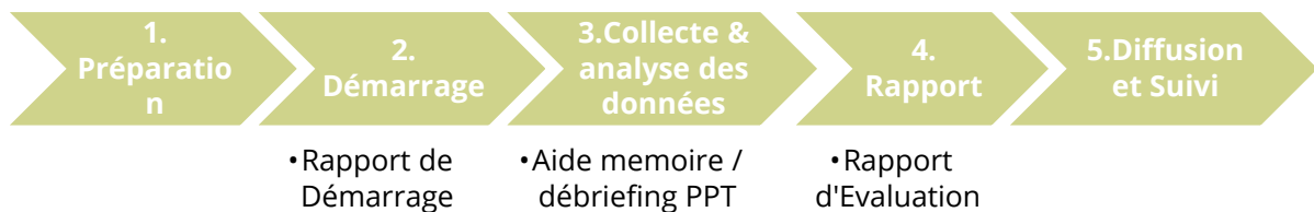
Illustration 1 : Carte du résumé du processus

Phase de planification : menée par le bureau de délégation du PAM