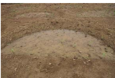
半月型の貯水池。とても硬く何も植えられなかった土地にも、今は作物を育てることができるようになり、住民は喜んでます。

食料不足の要因としては、農業の不振と食料輸入への過剰な依存が挙げられます。これは、農業市場の自由化、輸入関税の撤廃、農業補助金の停止等がもたらした結果で、消費食料の半分以上、米に関しては83%を輸入に頼っています。そのため、インフレや国際市場の価格変動に脆弱で、主要な食品の消費者価格が中南米諸国の中でも30〜77%も高いことも影響し、貧しい人たちが価格高騰で食料を手に入れられなくなっています。