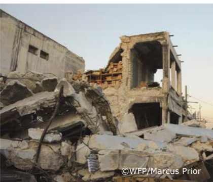
100万人以上が家を失い、公園や道路での野宿が余儀なくされました。

現在は徐々に再開された学校もあり、国連WFPは緊急支援に加え、学校給食支援など、長期的な支援活動も実施しています。ハイチの復興・発展のためには、これからも継続的な支援が必要です。