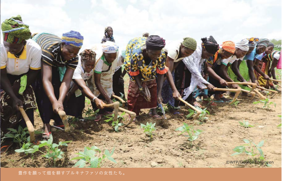
豊作を願って畑を耕すブルキナファソの女性たち。

「種まきは完了したので、無事育つように祈っています。収穫によつて私たちの生活は良くなると思います」と支援参加者の一人は希望を話しました。気候変動の影響を大きく受けるのは既に脆弱な立場にいる人々です。SDGsが掲げる「誰一人取り残さない」世界の実現を目指し、「飢餓をゼロに」を10年後に達成できるよう、今、行動しましょう。