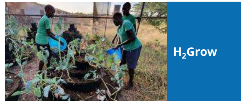
H 2 Grow

FtMA は官民の機関によるグループで、小規模農家による自給自足農業からマーケット志向の農業へと移行することを支援しています。