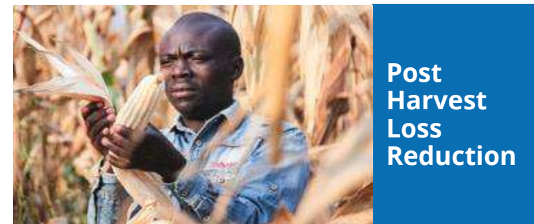
Post Harvest Loss Reduction

H 2 Grow は、環境が厳しく飢餓の脅威にある人々に対して、水耕栽培技術を通じて農作物を育てられるようにしています。