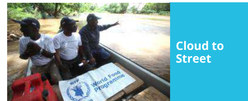
Cloud to Street

Cloud to Street は、洪水をリアルタイムで予測し、マッピングして分析するリモート・センシングのプラットフォームのプログラムです。