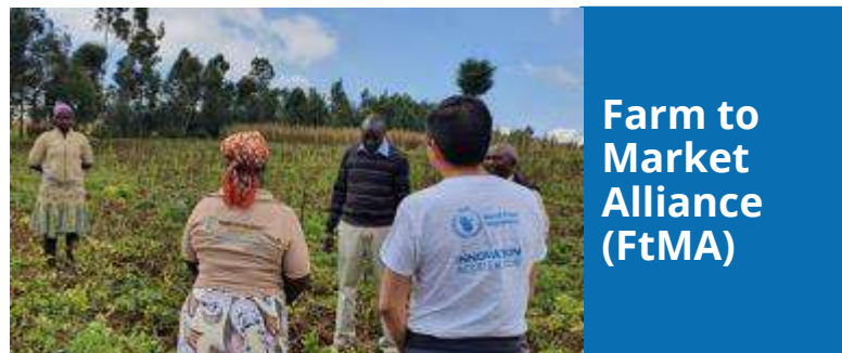
Farm to Market Alliance (FtMA)

EMPACT はデジタル・スキルのトレーニングコースです。難民や国内避難民、脆弱なホストコミュニティの人々が土地を離れても仕事に就けるようにしています。