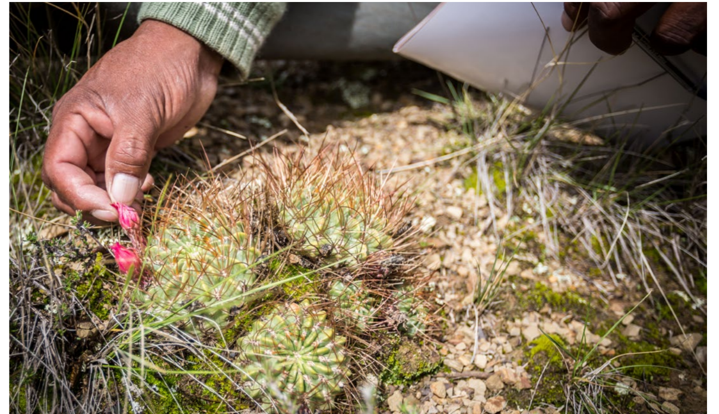
Prosuco - Bolivia