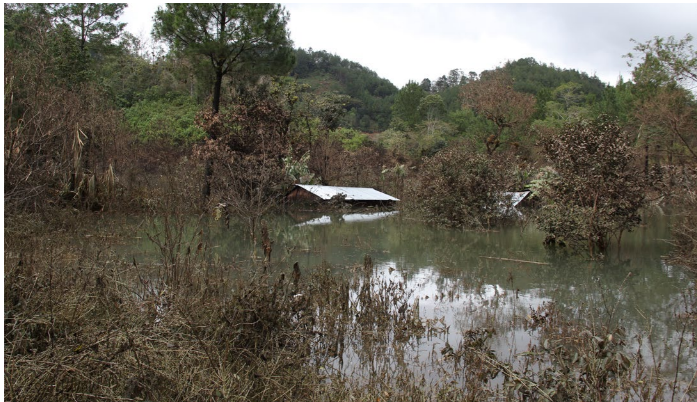
WFP - Guatemala