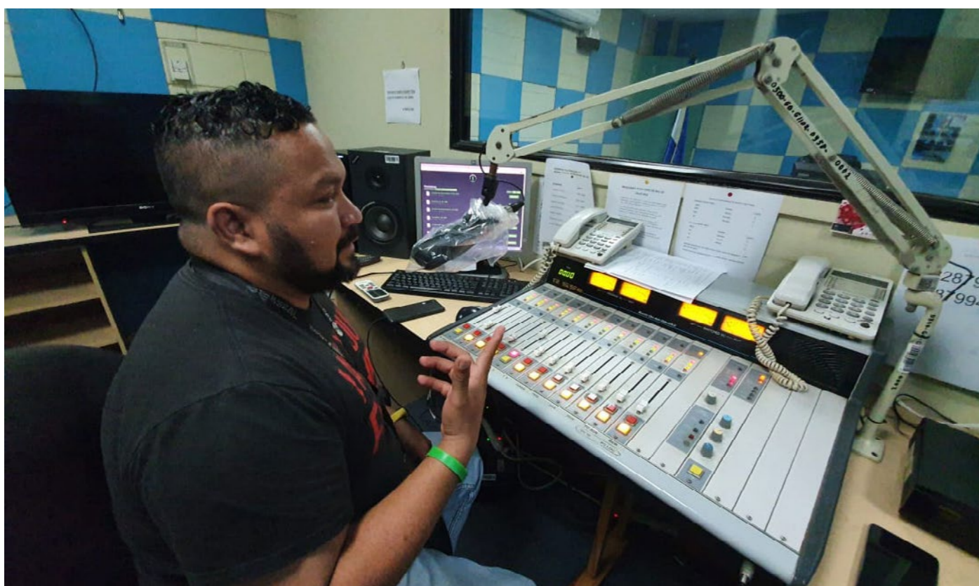
WFP - El Salvador