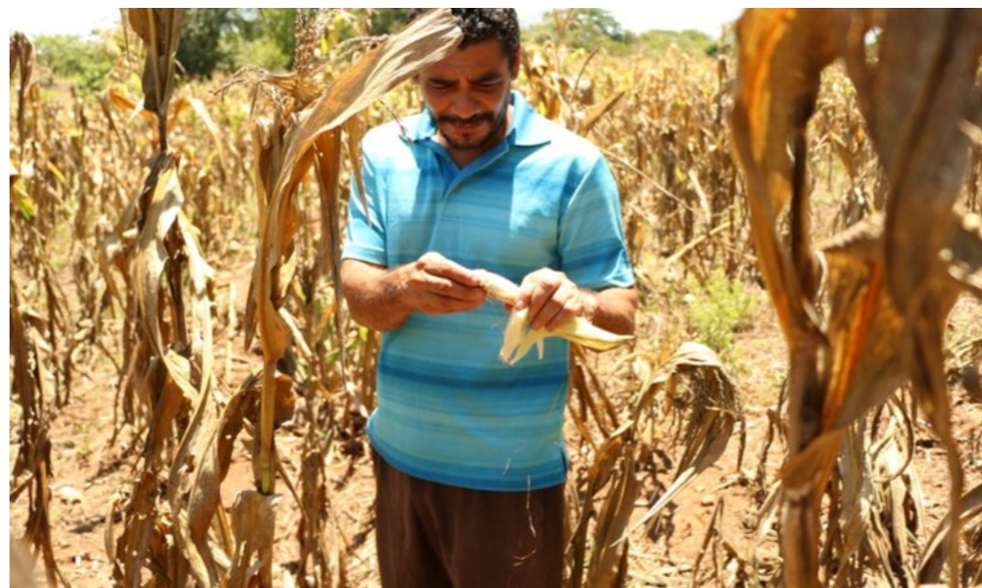
WFP - Oscar Duarte