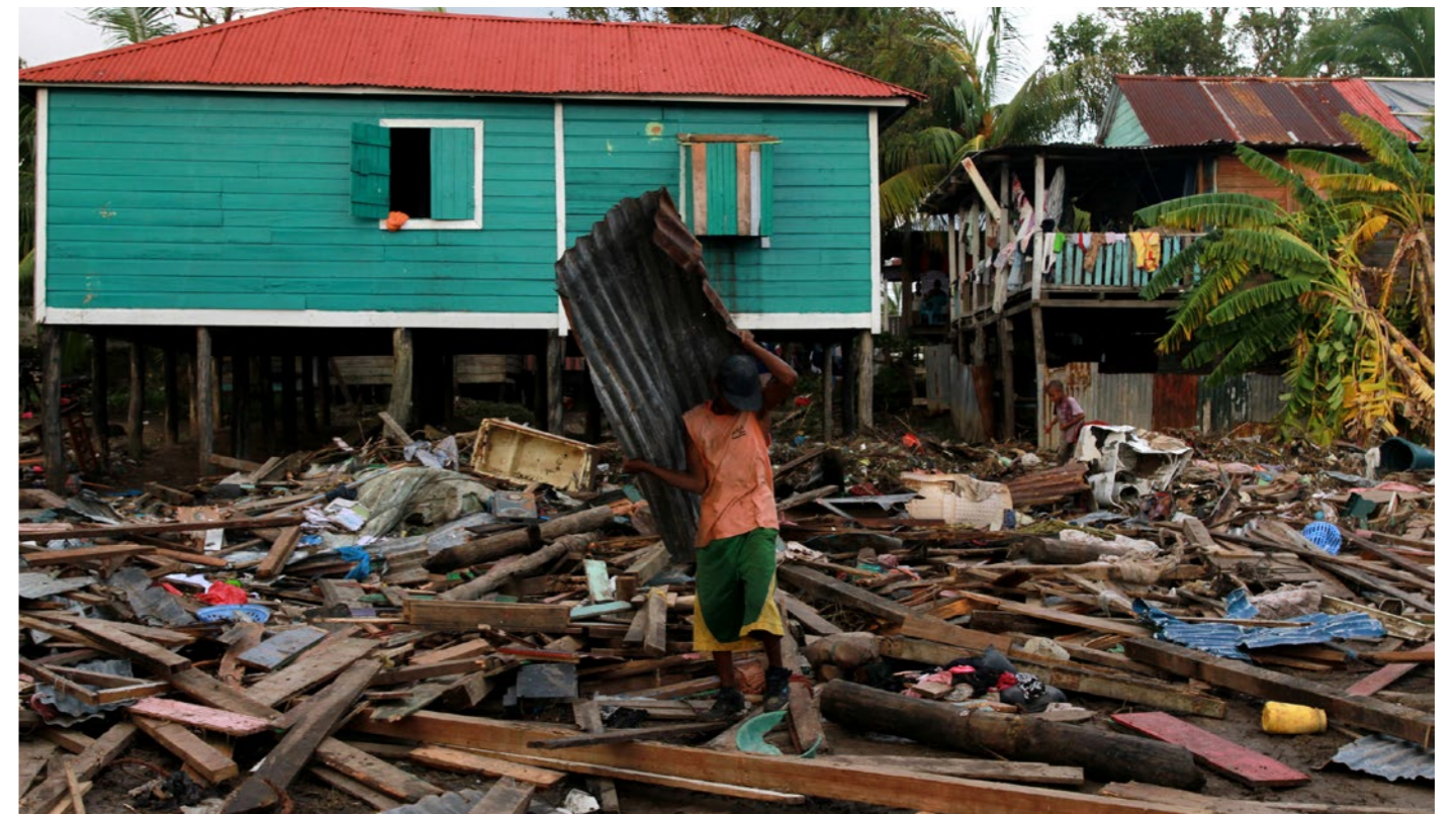
WFP - Rocío Franco