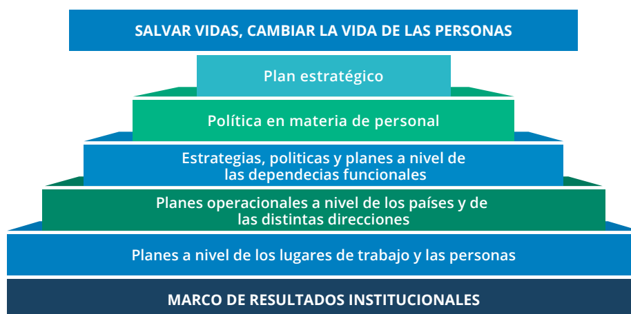
Figura 1: La política del PMA en materia de personal en su contexto