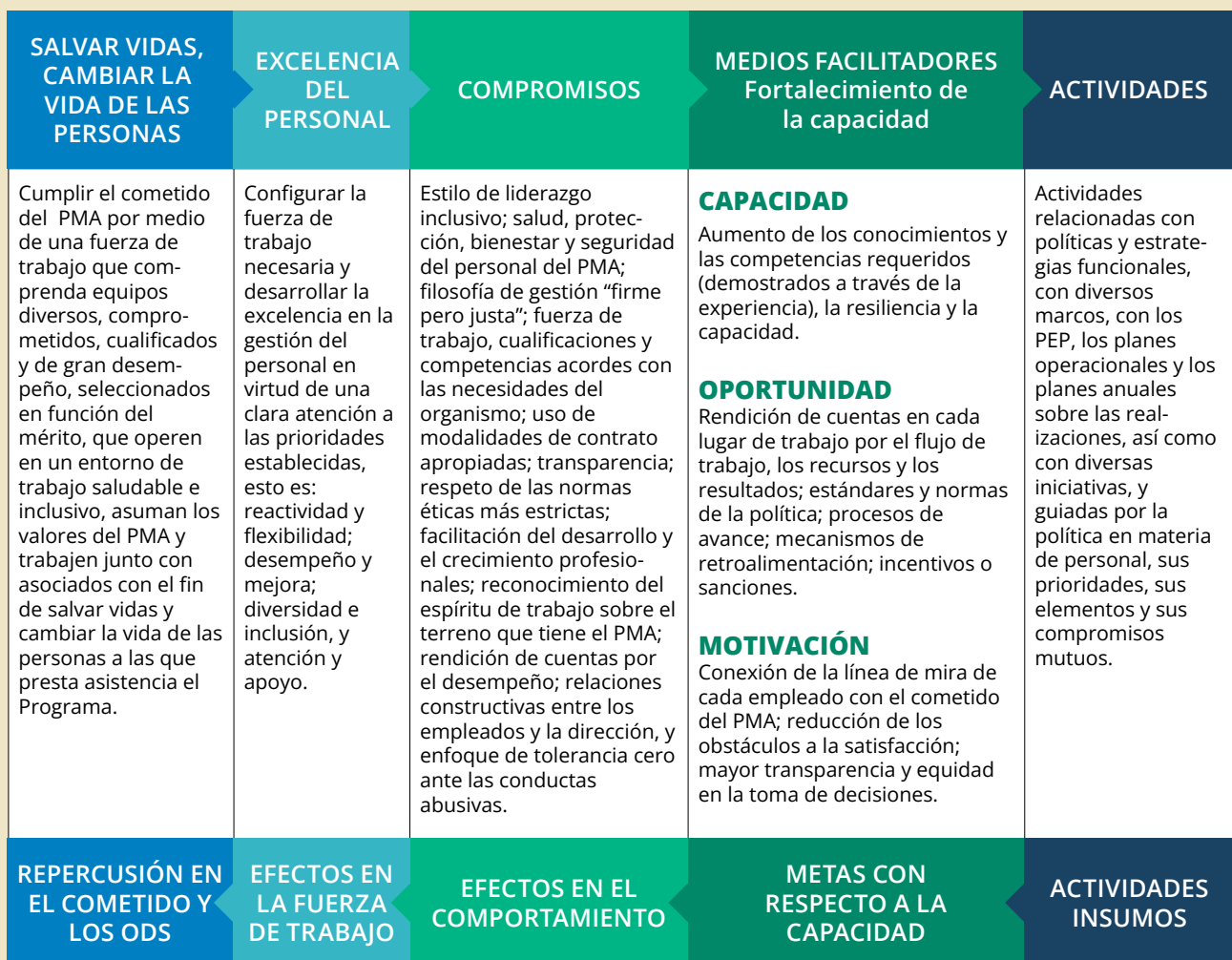
Figura 2: Teoría del cambio de la política del PMA en materia de personal

29. La teoría del cambio en la que se sustenta la política en materia de personal se presenta en la figura 2.