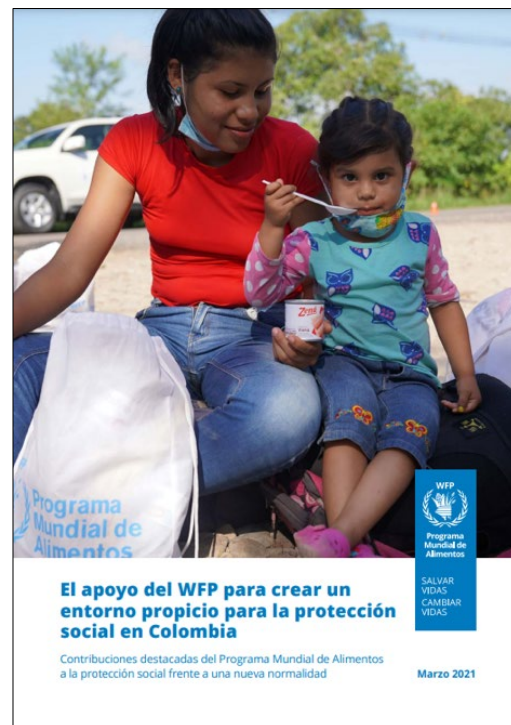
Figura 1. Evidencia generada en el piloto de Arauca