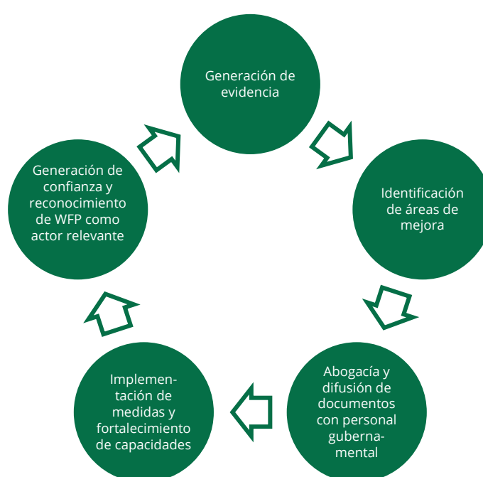
Figura 3. Ciclo de involucramiento de WFP en Colombia

Si bien la pandemia y la llegada de migrantes permitieron poner a prueba las capacidades existentes de respuesta frente a emergencias, aún queda pendiente poner a prueba estas capacidades para responder a otro tipo de eventos (como desastres naturales). Algunos de los esfuerzos realizados al momento de escribir este estudio de caso por el Gobierno de Colombia en conjunto con WFP están orientados en este sentido: de acuerdo con personal gubernamental entrevistado, la consolidación en un solo lugar (el nuevo Registro Social) de la mayor parte de la información gubernamental es una apuesta a facilitar una respuesta más ágil a diferentes emergencias, como los desastres naturales. Los proyectos piloto, como el realizado en Arauca, han proporcionado aprendizajes valiosos para atender a la población migrante , lo que sugiere la necesidad de desarrollar pilotos específicos para enfrentar otro tipo de emergencias. Estas acciones serán fundamentales para continuar fortaleciendo la capacidad de respuesta del Gobierno de Colombia en diferentes escenarios de crisis. En particular, fortalecer la capacidad de identificar de forma oportuna a personas que requieren atención y encontrar los mecanismos institucionales que permitan realizar un apoyo de forma integral por parte de las diferentes agencias gubernamentales.